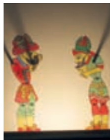
Karagöz & Hacivat