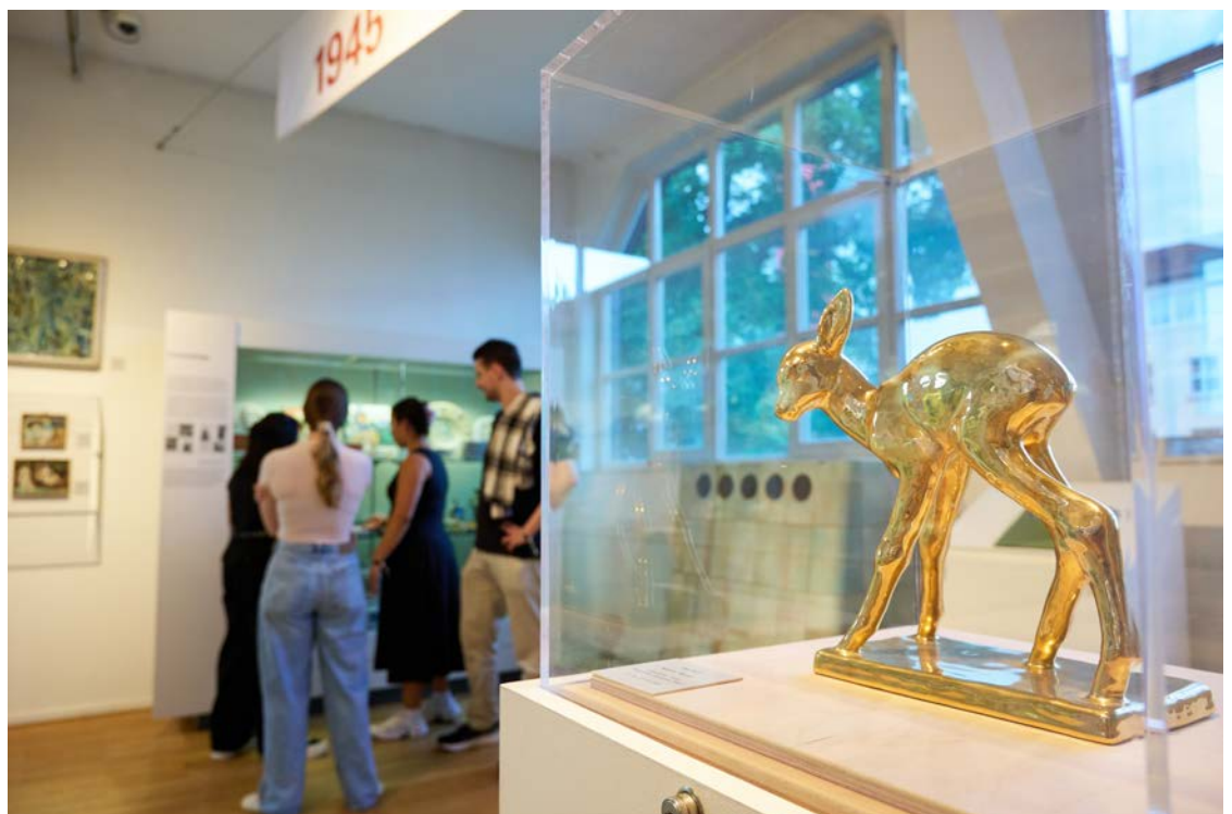
Die heute als „Bambi“ bekannte Figur wurde 1936 als „Rehkitz“ von Else Bach entworfen.

Inszenierungen wie der originalgetreue Nachbau eines Kaufhaus-Schaufensters der 1930er-Jahre oder eine Nische der Frankfurter Messe um 1960 vermitteln den jeweiligen Zeitgeist.