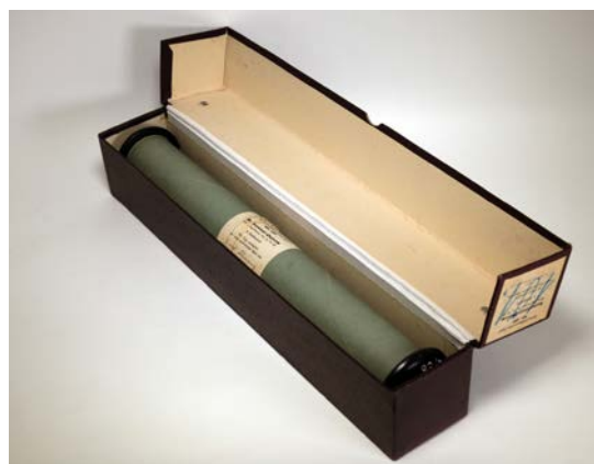
Notenrolle Nr. 491 für Welte-Philharmonie-Orgel, nach 1924