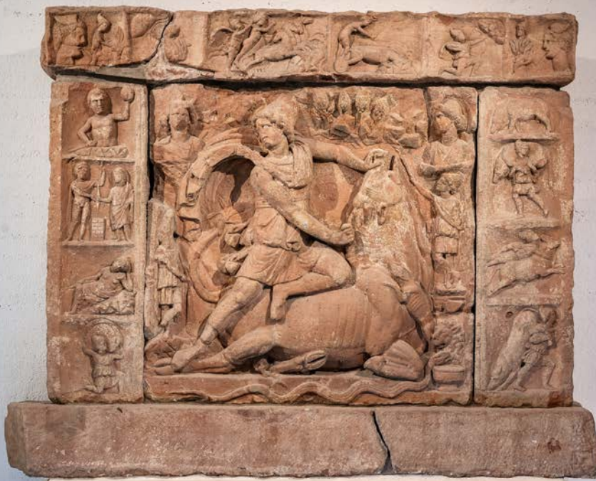
Das antike Mithras-Relief ist aus großen Segmenten zusammengesetzt. Es wird demontiert und die Stücke einzeln verpackt.

bis hin zu großformatigen mittelalterlichen Flügelaltären. Jedes Objekt stellt das Team vor individuelle logistische Herausforderungen. So wird etwa das monumentale Mithras-Relief im Frühsommer mithilfe eines Krans und mit Spezialwerkzeug von der Wand gelöst. Es besteht aus einzelnen Segmenten, die wie Bausteine zusammengesetzt sind und nun Stück für Stück demontiert werden. Jedes Segment wiegt zwischen 1,5 und 1,8 Tonnen und wird auf stabilen Paletten gesichert, bevor es verpackt wird.