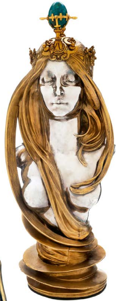
Badisches Prunkschwert, Stadtwächter, Bambi, Mucha-Büste – welches Objekt passt zu Ihnen?