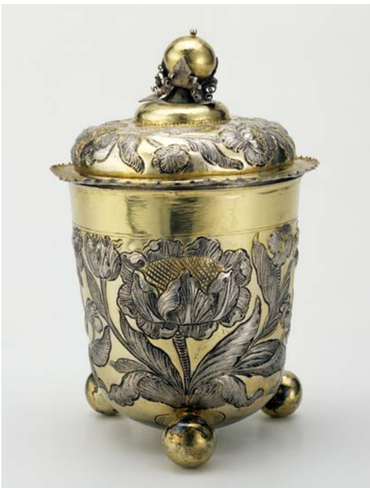
Johann Georg Burckhardt, Deckelbecher, Silber, Durlach, um 1670–1680

Christina Lehnert: Ich denke, dass in jedem der Objekte sowohl dekorative Schönheit als auch gesellschaftliche Bedeutung liegt. Die Vorstellung, etwas sei zu einem bestimmten Zeitpunkt „nur“ dekorativ, greift zu kurz – denn es musste ja als schön wahrgenommen und kulturell eingeordnet worden sein. Dass die Blume ein über Jahrhunderte hinweg wiederkehrendes