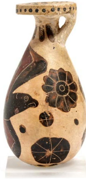
Antikes Gefäß für duftendes Salböl mit der Darstellung eines Vogels und vielen Rosetten, korinthisch, Ende 7. Jh. v. Chr.