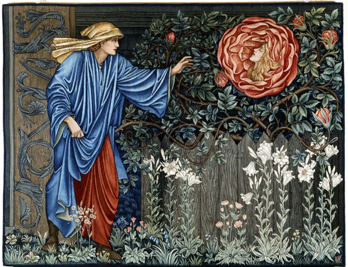
Sir Edward Burne-Jones und William Morris, Wirkteppich „Der Pilger im Garten oder das Herz der Rose“, Entwurf: London, vor 1896, Ausführung: Merton Abbey, London, 1901