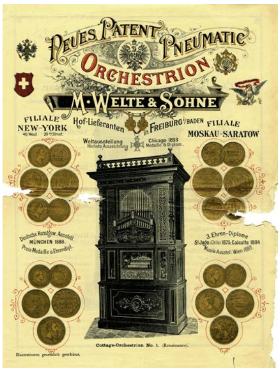
Werbeblatt „Cottage-Orchestrion No. 1“, M. Welte & Söhne, um 1893. Es verweist auf Filialen in New York und Moskau-Saratow, zahlreiche Auszeichnungen sowie den internationalen Absatzmarkt des Unternehmens.

Produktion und Handel sind heute global vernetzt – das ist ein typisches Phänomen unserer Zeit. Doch der Schein trügt! Ein dichter internationaler Austausch kennzeichnete bereits die Zeit seit der Industrialisierung ab 1850 bis zum Vorabend des Ersten Weltkriegs: von der Entwicklung und Herstellung bis zum Vertrieb von Waren aller Art.