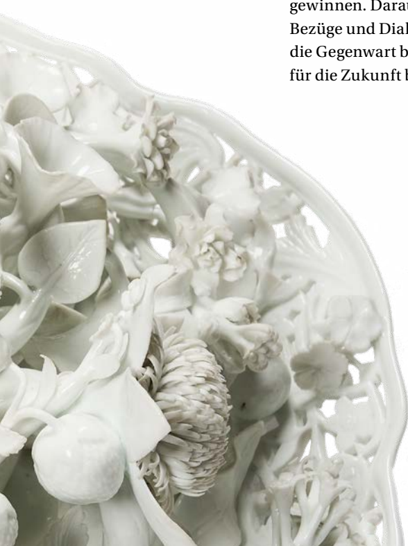
Teller mit naturalistisch gestalteten Blumen und Früchten aus Porzellan, erworben durch Caroline Luise von Baden, Staatliche Porzellan-Manufaktur Meißen, um 1750

Christina Lehnert: Ich verlasse mich da ganz auf die Vielfalt der Künstler*innen und Objekte. Ich persönlich lege allerdings immer Wert auf Blumensträuße, sei es im Foyer der Kunsthalle oder zu Hause.