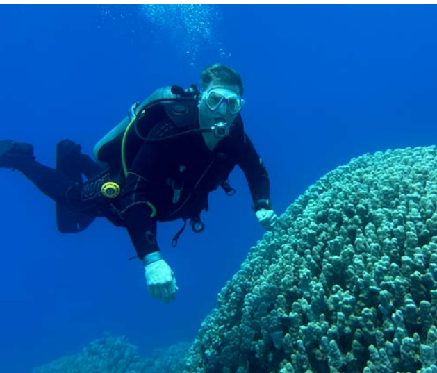
Eckart Köhne blickt in echo in die Zukunft: „Das Badische Landesmuseum macht keinen Urlaub“. Den gibt es nur einmal im Jahr für ihn beim Tauchen am anderen Ende der Welt.

— Was haben antike Töpfer, eine Gruppe junger Ukrainer*innen und ein tauchender Museumsdirektor gemeinsam? Ihre Geschichten begegnen sich auf echo , dem digitalen Magazin des Badischen Landesmuseums. Während das Karlsruher Schloss saniert wird und die Sammlungen öffentlich nicht zugänglich sind, öffnet echo die Türen zu bislang Verborgenen: Hier erzählen Museumsmitarbeiter*innen und Gastautor*innen ihre persönlichen Geschichten.