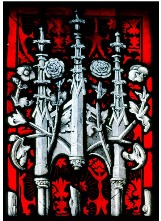
Peter Hemmel von Andlau, gotischer Baldachin mit Blumen, Glasmalerei, um 1480