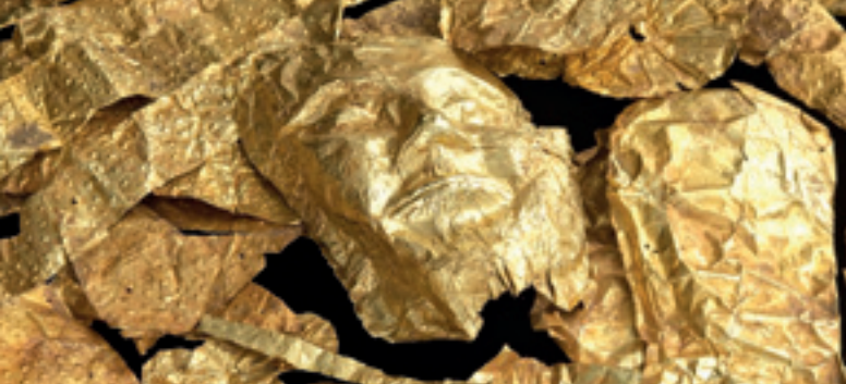
Goldobjekte aus der Raubgrabung eines Friedhofs bei Thessaloniki, 2011 konfisziert.