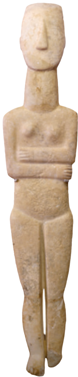
Kykladenidol, 2700-2300 v. Chr., aus der Sammlung des Badischen Landesmuseums und 2014 an Griechenland restituiert.